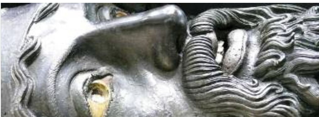
Uno dei Bronzi di Riace, particolare del volto: disteso, come è rimasto a lungo, precluso alle visite

La promozione decolla sui social, e il territorio fa sistema