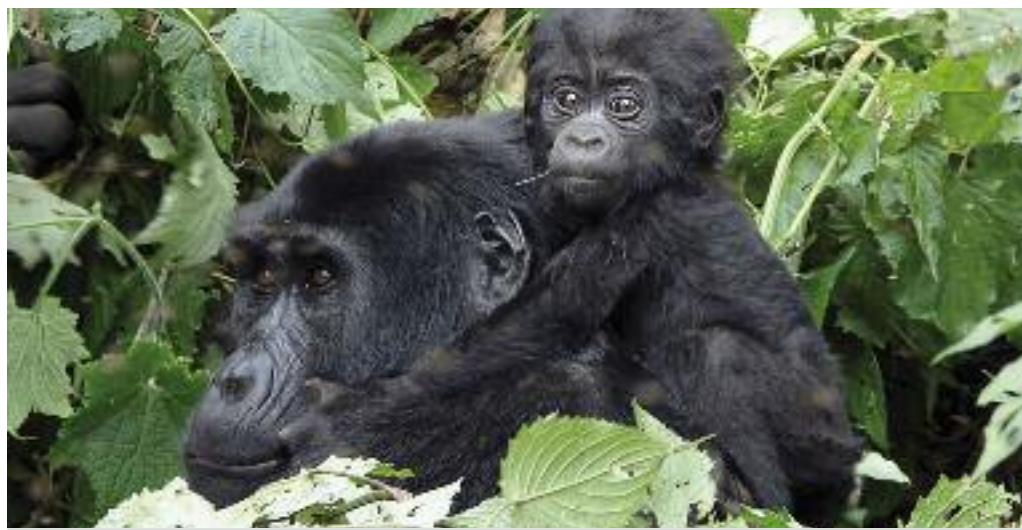
408 Gorilla di Montagna in Uganda nei parchi Bwindi Impenetrable NP e Mgahinga Gorilla NP

Viaggio nell'accogliente Uganda con la African Travel Association