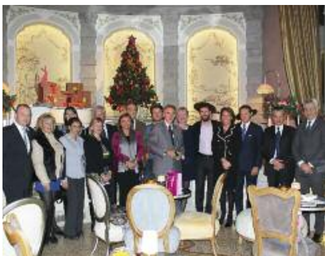
Forum al Château Monfort di Milano: i partecipanti

All'agente di viaggi che voglia dedicarsi ai clienti del prezioso segmento lusso – la gran parte neppure sfiorati dalla crisi e ancora più pronti a partire – servono doti di creatività e di ascolto, propositività e riflessi pronti, relazioni forti con i fornitori. E forse più di tutto serve la sincerità che fedeltà. Dunque si fa presto a dire lusso, come si è detto nel Forum organizzato da L'Agenzia di Viaggi e Planetaria Hotels allo Château Monfort, 5 stelle milanese. > a pag. 4